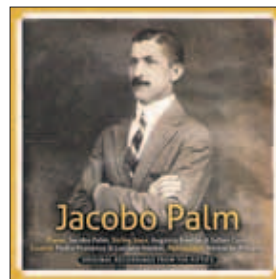
De cd met 17 oorspronkelijke opnamen uit de beginjaren '50.